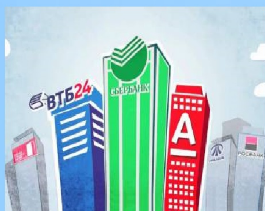
Схема 6. Звонки и сообщения из банка. («на вас кто-то прямо сейчас оформляет кредит», «прямо сейчас у вас списываются деньги», «замечаем в последние дни странные операции по вашей карте», «вам надо опередить мошенников и спрятать свои средства на безопасном счету»)

Схема 5. Оплата услуг по фейковому QR-коду. (человеку предоставляют QR-код не с официального сайта и предлагают оплатить услугу «через камеру гаджета»)