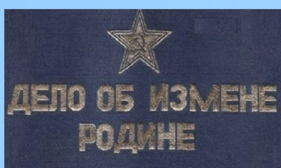
Схема 7. Звонки и сообщения от государственных ведомств. («вам звонит следователь/дознаватель/судебный пристав/оперативник ФСБ...»), «на вас заведено уголовное дело», «продиктуйте ваши данные, я все проверю»)

Схема 6. Звонки и сообщения из банка. («на вас кто-то прямо сейчас оформляет кредит», «прямо сейчас у вас списываются деньги», «замечаем в последние дни странные операции по вашей карте», «вам надо опередить мошенников и спрятать свои средства на безопасном счету»)