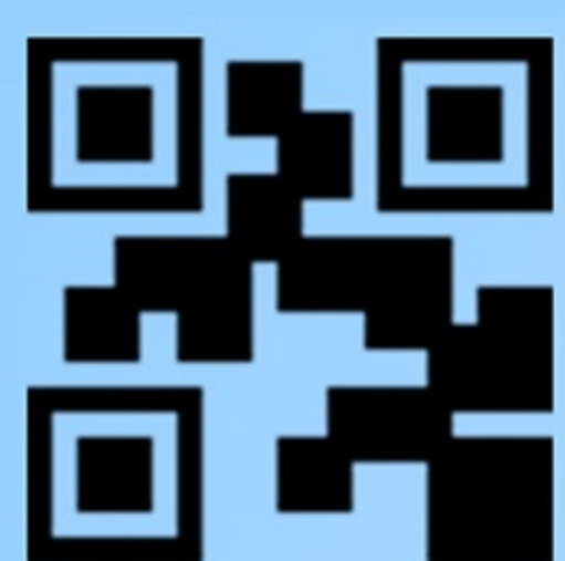
Схема 5. Оплата услуг по фейковому QR-коду. (человеку предоставляют QR-код не с официального сайта и предлагают оплатить услугу «через камеру гаджета»)

Схема 4. Звонки или сообщения от знакомых. («я в беде, связи нет, говорить не могу, нужны деньги», «проголосуйте за моего родственника вот по этой ссылке», «посмотри хороший материал - пройди по ссылке»)