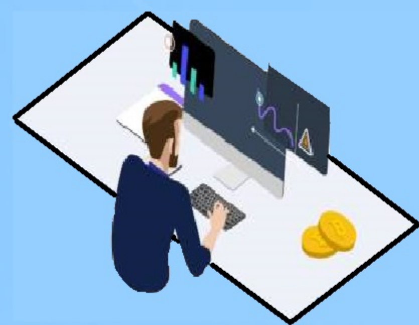
Схема 2. Предложения от лжеброкеров. («откроем брокерский счет для получения прибыли», «оплатите страховой взнос за инвестиции», «продиктуйте свои данные для регистрации в нашей брокерской компании»)

Схема 1. Операторы сотовой связи. («действие вашей сим-карты заканчивается», «какой у вас оператор связи?», «продиктуйте код из СМС»)