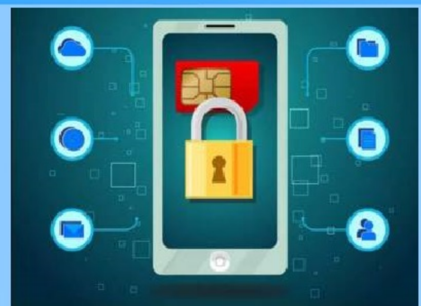
Схема 1. Операторы сотовой связи. («действие вашей сим-карты заканчивается», «какой у вас оператор связи?», «продиктуйте код из СМС»)