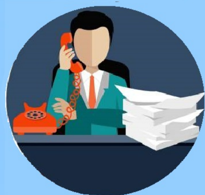
Схема 3. Общение с работодателем. («заполните анкету в ходе нашего онлайн-общения», «укажите данные банковской карты для перечисления будущей зарплаты», «предоставьте персональные данные для бухгалтерии/кадровика»)

Схема 2. Предложения от лжеброкеров. («откроем брокерский счет для получения прибыли», «оплатите страховой взнос за инвестиции», «продиктуйте свои данные для регистрации в нашей брокерской компании»)